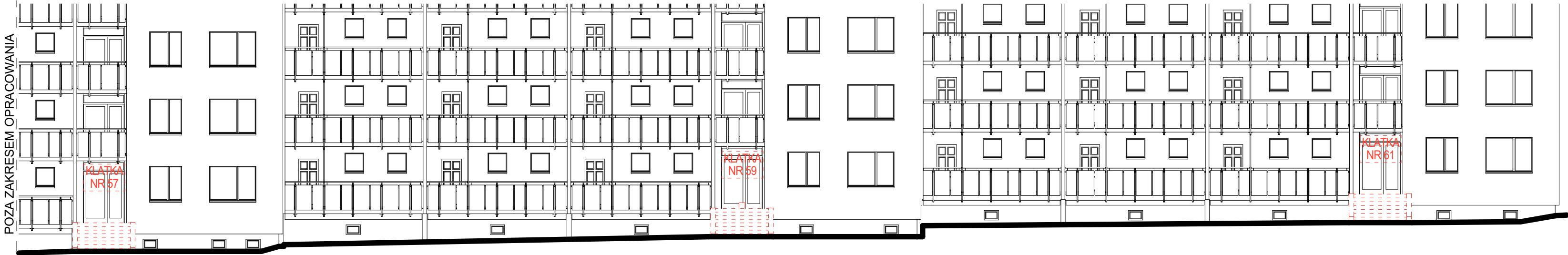
ELEWACJA WSCHODNIA rozbiórki